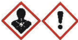
Нов дизайн на съществуващите символи

Ръководството, текстът на Регламент ЕС/1272/2008, както и въпроси и отговори относно регламента са на разположение на английски език на интернет страницата на Европейската агенция по химикалите (ECHA) http://echa.europa.eu/classification_en.asp